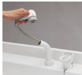
シングルレバー シャワー混合水栓