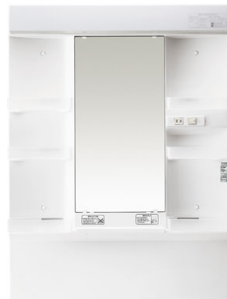
スタンダードLED 1面鏡 W750mm